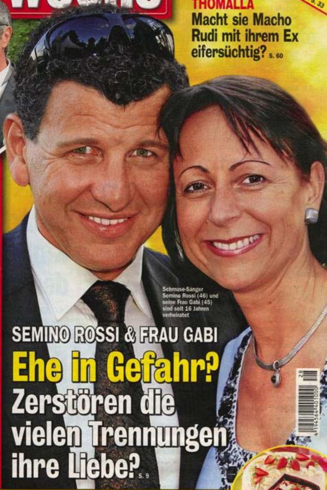
Schmuse-Sänger Semino Rossi (46) und seine Frau Gabi (45) sind seit 16 Jahren verheiratet

BRIGITTE NIELSEN Beauty-Wahn! 6 OPs in 2 Wochen - alles wegen Geld s. 65