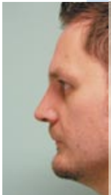
nach der Operation